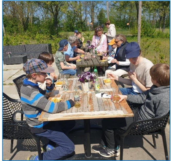
De gezellige afsluiting van de wedstrijd