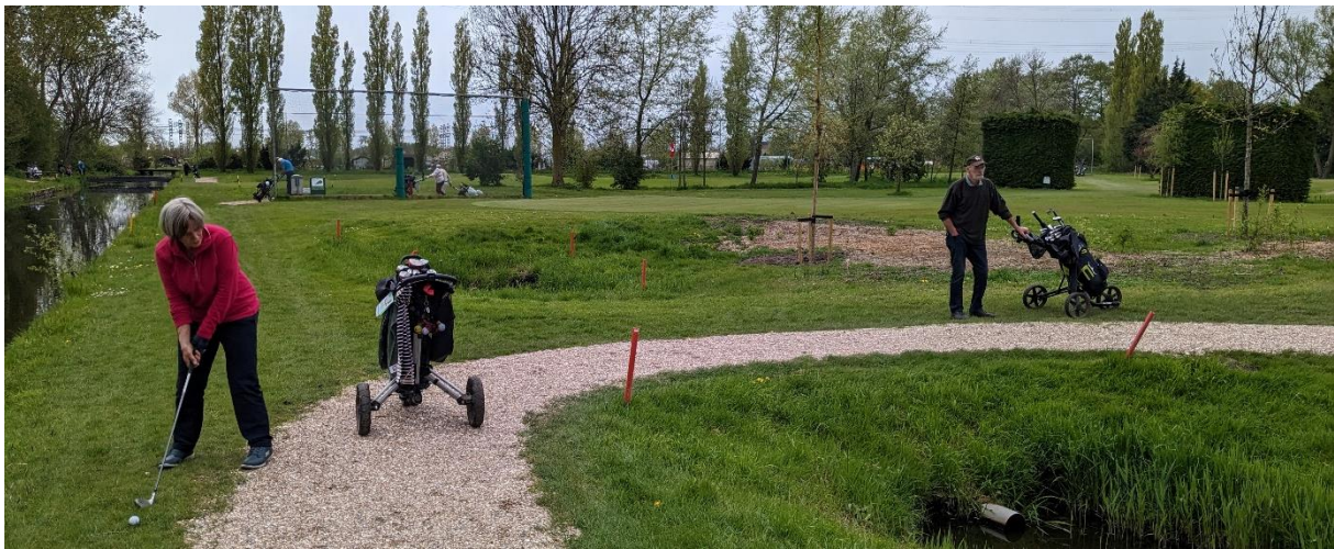
De tweede slag naar de green van hole 2

De wedstrijdcommissie streeft ernaar de wedstrijden zo laagdrempelig mogelijk te maken. Dat gebeurt door iedereen met baanpermissie en handicap, hoog of laag, te verwelkomen. De inloopwedstrijd van woensdag is daar een mooi voorbeeld van. Hoge en lage handicappers gaan met elkaar de baan in om 9 holes te spelen. Meestal wordt er greensome gespeeld, waardoor een mindere slag altijd gecompenseerd kan worden door de medespeler. Daarnaast is de sfeer in de flights altijd ontspannen en gezellig en is het meespelen belangrijker dan winnen. Tijdens de wedstrijd komt het geregeld voor dat meer ervaren spelers de minder ervaren tal van aanwijzingen geven, waardoor ze hun spel zouden kunnen verbeteren. Natuurlijk heeft iedereen kans om te winnen, want de handicaps worden bij het bepalen van de uitslag verrekend. De inleg is een mooie schone golfbal, die in de prijzenpot gaat. De prijsuitreiking vindt plaats onder het genot van een kopje koffie op de "10 e hole". Daar wordt natuurlijk ook nagepraat over de wedstrijd. En de sfeer? Die is zeer open: iedereen dient zich welkom te voelen en dat lijkt ook echt zo te zijn! Nieuwsgierig? De wedstrijd begint iedere woensdag om 9.30 uur. Inschrijven tot 9.15 uur bij het startershuisje. Rond 11.00 uur zitten we aan de koffie.