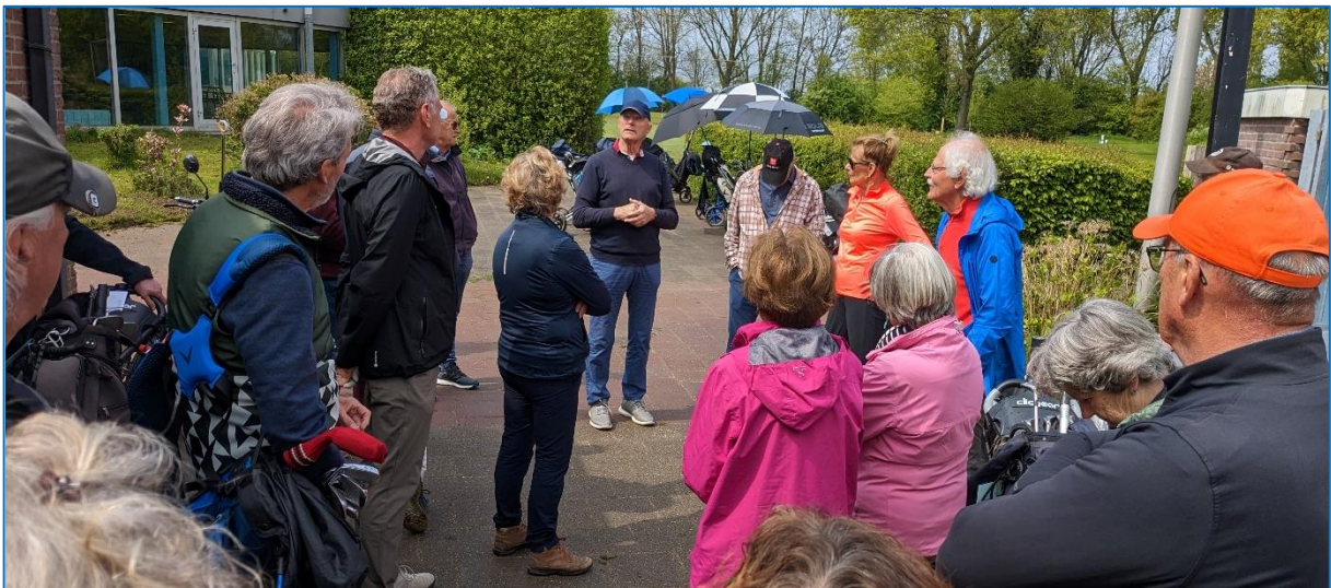
Altijd wordt de spelvorm voor het begin van de wedstrijd uitgelegd

Onze vereniging telt zo'n 300 actieve leden, die regelmatig op de baan te vinden zijn. Gewoon om individueel of in een groepje een balletje te slaan en te genieten van onze mooie baan en het leuke golfspel. Van die 300 leden neemt slechts een klein percentage deel aan de wedstrijden, die elk seizoen door de wedstrijdcommissie georganiseerd worden. En dat is jammer, want naast het recreatieve karakter, die het golf voor ons heeft, is het echte een wedstrijdssport.